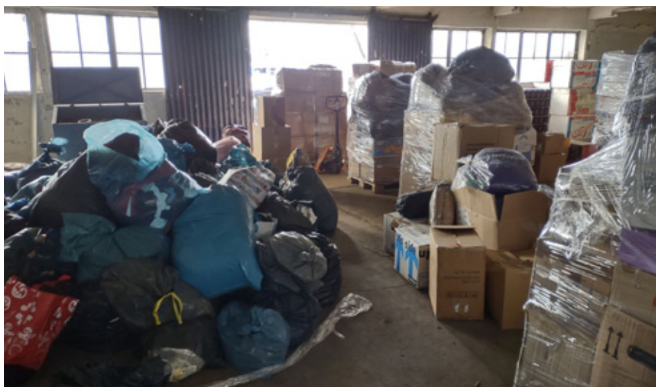
Hilfsgüter werden verladen und direkt in die Ukraine transportiert