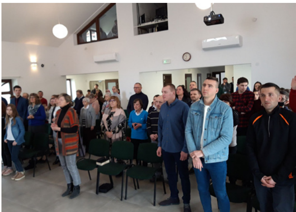
Gottesdienst letzten Sonntag. Die Hälfte der Besucher sind Flüchtlinge aus der Ukraine