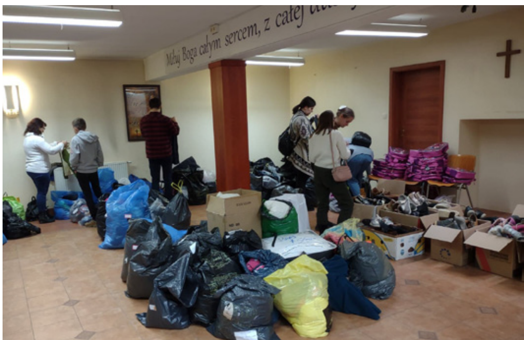
Kleiderverteilung für Flüchtlinge in der Gemeinde